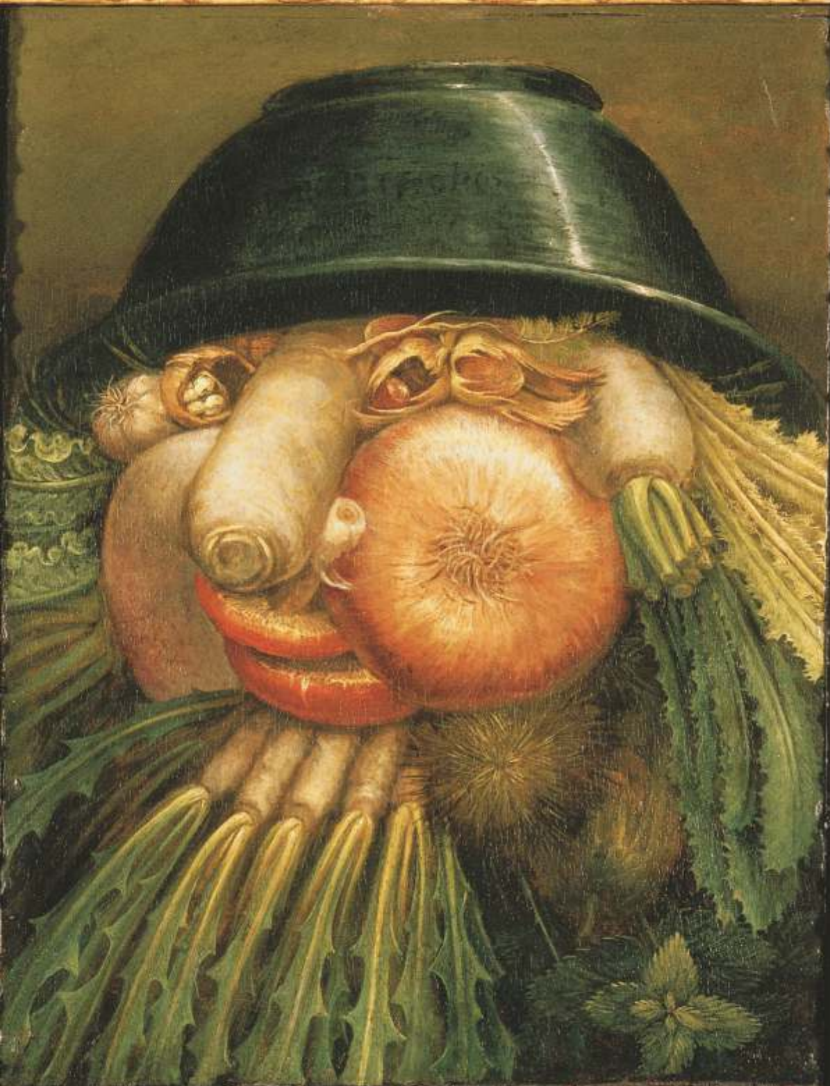
G. Arcimboldo, l'Ortolano , Museo Civico Ala Ponzone, Cremona