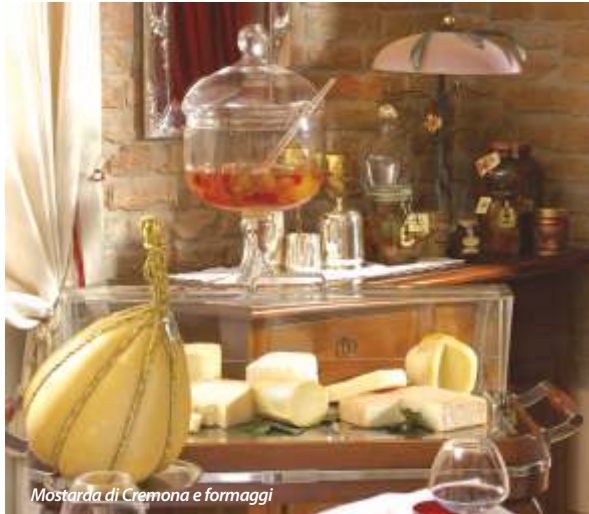
Mostarda di Cremona e formaggi

La prima ricetta Pour faire moustarde de Cremona [per fare la mostarda di Cremona] apparve in un libro a stampa del 1604: l' Ouverture de Cuisine di Lancelot de Casteau, cuoco del principe vescovo di Liegi, con il quale avevano rapporti commerciali gli Affaitati, ricchi mercanti cremonesi attivissimi nelle Fiandre alla fine del Cinquecento. Fra gli ingredienti vengono indicati la frutta candita, la senape, lo zucchero e un colorante vegetale, il tornasole, che le avrebbe