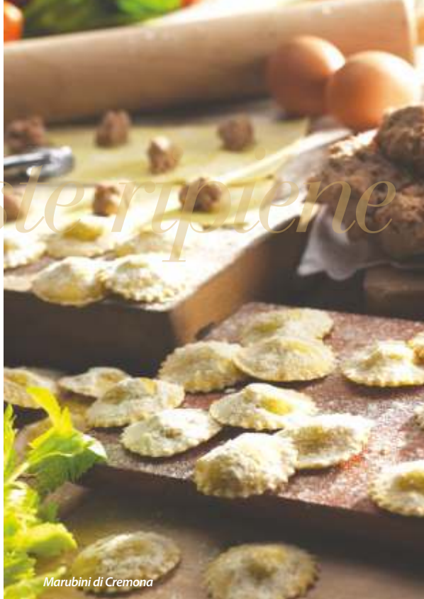
Marubini di Cremona

asciutti, in cui il dolce e il salato di amaretti, uva sultanina, cedri canditi, biscotti speziati detti mostaccini e marsala si amalgamano con un gusto insolito che può ricordare la cucina speziata veneziana e quella arabo mediterranea da cui deriva; i blisgòn di Casalmaggiore , tortelli di zucca, un po' più grandi di quelli mantovani, da condire con soffritto di lardo e pomodoro, ma anche con burro fuso e grana.