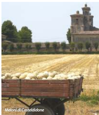
Meloni di Casteldidone