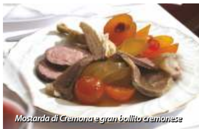
Mostarda di Cremona e gran bollito cremonese

Nel Cinquecento Cremona e il suo territorio erano noti anche per la produzione di conserve di frutta a base di mele cotogne e ancora oggi si producono nel territorio cremonese sia la cotognata , sia la conserva senapata (conserva di mele cotogne, insaporita con la senape), entrambe commercializzate nelle caratteristiche scatolette di legno.