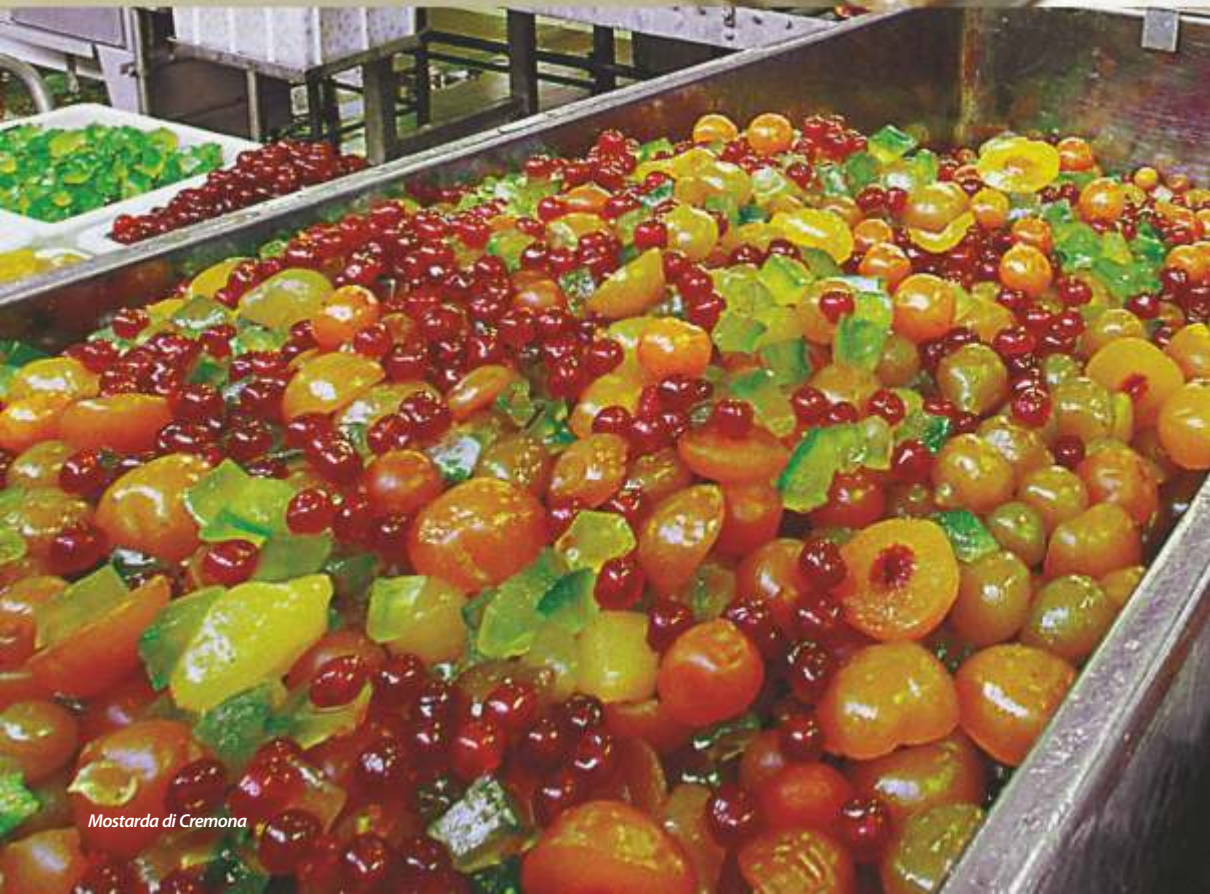
Mostarda di Cremona