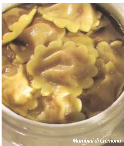
Marubini di Cremona

Le paste ripiene del Cremonese riflettono le divisioni storiche del territorio che hanno visto Cremona e il suo circondario legati a Milano; Crema e il Cremasco a Venezia; Casalmaggiore e il Casalasco al Mantovano e alle sue tradizioni. Troviamo così tre tipi completamente diversi di pasta ripiena: i marubini di Cremona , ripieni di carne e cotti nei tre brodi ottenuti dalla cottura di carne di maiale, manzo e gallina; i tortelli di Crema , da mangiare