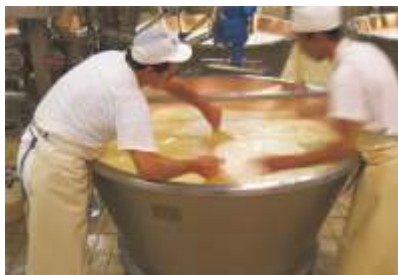
Fase di lavorazione del grana padano