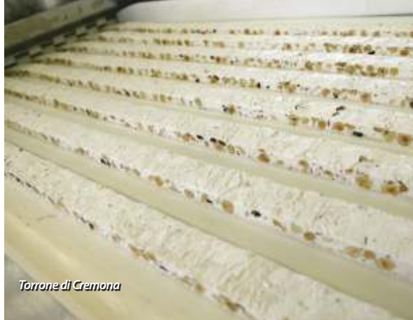
Torrone di Cremona

Testimonianza di M. (nato a Cremona nel 1935), in C. Bertinelli Spotti e A. Saronni, I Cremonesi a tavola - ieri e oggi , CremonaBooks, Cremona 2005