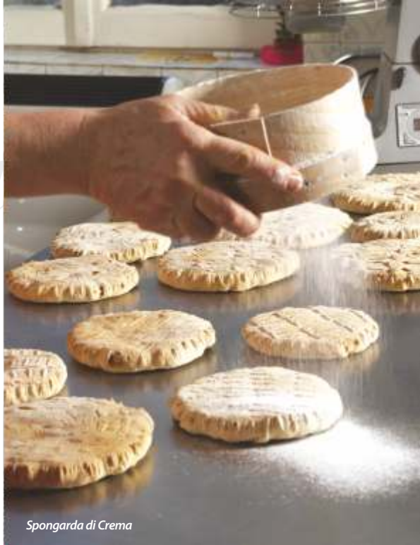
Spongarda di Crema

torta Bertolina (caratterizzata dalla farcitura con l'uva fresca).