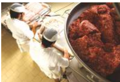
Fase di lavorazione del salame Cremona IGP

Il salame da pentola (una volta utilizzato insieme a carni di manzo e di pollo per la preparazione dei “tre brodi” in cui vengono cotti i marubini di Cremona )