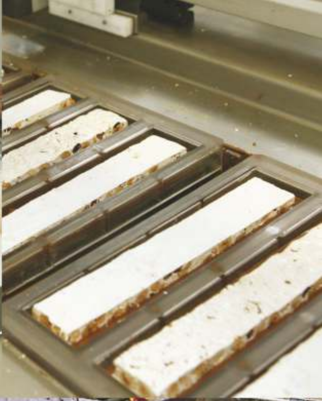
Fasi di lavorazione del torrone