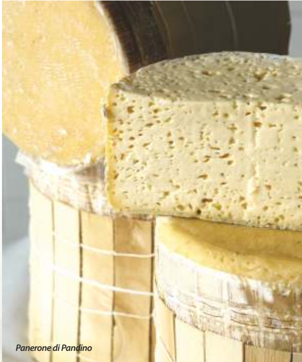
Panerone di Pandino

Mettete a riposare in frigorifero per almeno 2/3 ore. Al momento di servire aggiungete al salva un filo d'olio extra vergine d'oliva, una spruzzata di pepe e mescolate il tutto con delicatezza.