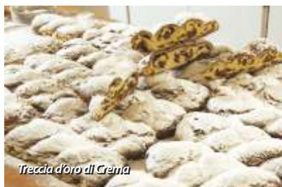
Treccia d'oro di Crema

Tipici di Crema e del Cremasco sono la treccia d'oro (pasta lievitata, cotta al forno con canditi di arancia e cedro e con uvetta), la spongarda (dolce ricco e raffinato tra i più antichi d'Italia) e la